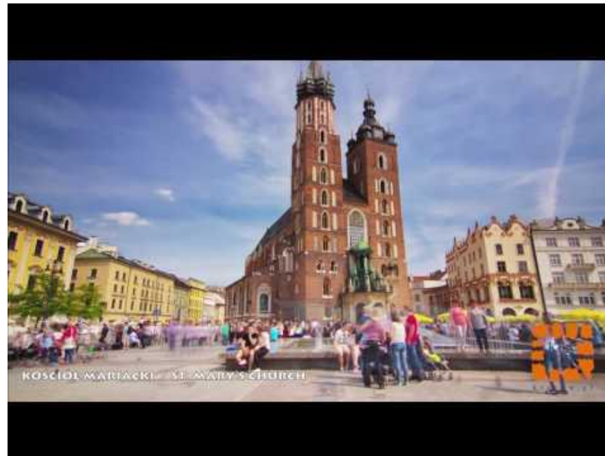
KLIKNIJ NA MNIE I OBEJRZYJ – KRAKOW CITY MADE OF MOMENTS - YOUTUBE.COM

Kraków to dawna królewska stolica Polski. Jest jednym z najpiękniejszych miast w Europie i najatrakcyjniejszych miejsc turystycznych. Całe średniowieczne Stare Miasto, z największym rynkiem głównym, uważanym za najpiękniejszy na świecie, należy do pierwszych miast wpisanych na Listę Światowego Dziedzictwa UNESCO. Uniwersytet Jagielloński jest jednym z najstarszych w Europie - założony w 1364 roku. Kraków nazywany jest kulturalną stolicą Polski. To miasto wielu zabytków, galerii sztuki, muzeów, klubów muzycznych, kawiarni i restauracji o zadziwiającym klimacie i doskonałej kuchni.